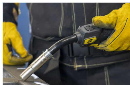
Uchwyt Exeor MIG z regulacją parametrów w rękojeści