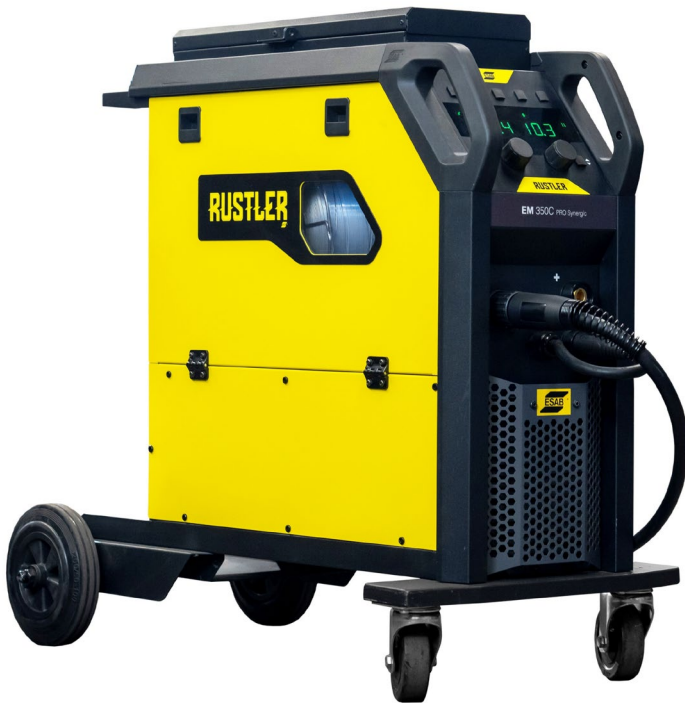
Rustler EM 350C PRO Synergic