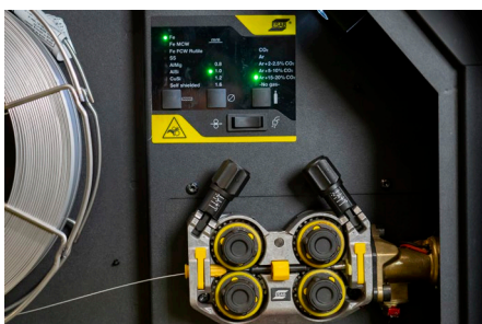
Najlepszy w swojej klasie mechanizm podawania drutu

Więcej informacji znajdziesz na esab.com .